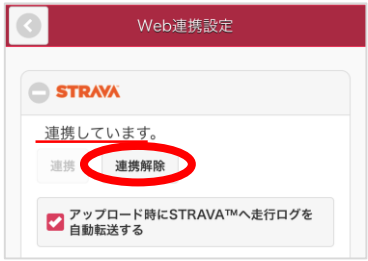
「連携解除」をクリック

「連携しています」という表示になっていることを確認し、「連携解除」をクリックします。