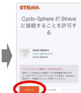
「許可する」をクリック